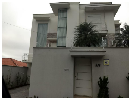
Representação Descrição Data Foto