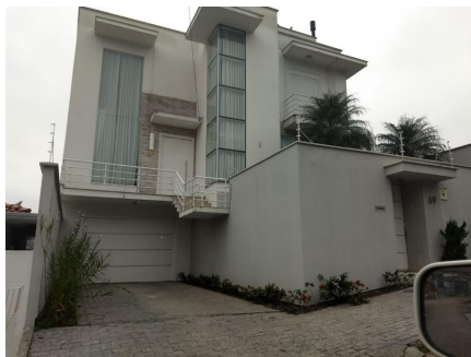
Representação Descrição Data Foto