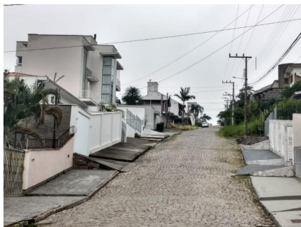
Representação Descrição Data Foto