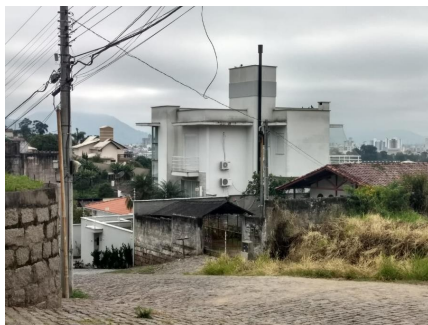
Representação Descrição Data Foto