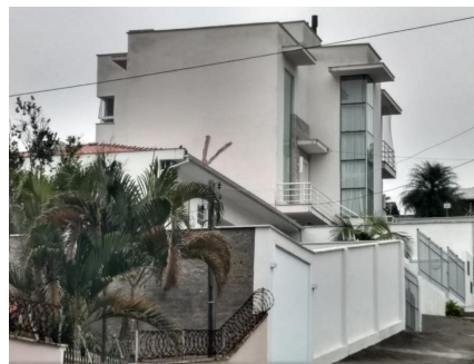
Representação Descrição Data Foto