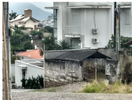
Representação Descrição Data Foto